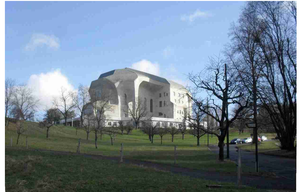
Denkmalgeschütztes Goetheanum in Dornach

Bei sehr schlechtem Wetter verschieben wir auf Samstag, 17. Juni.